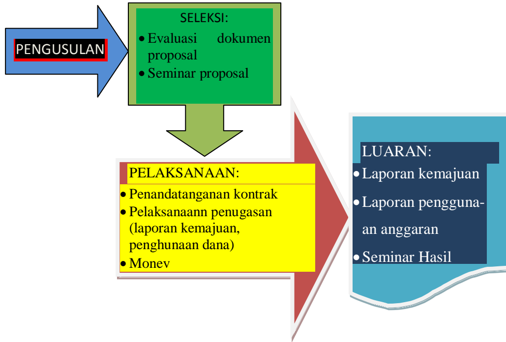
Gambar 2.1: Tahapan Kegiatan Penelitian dan Pengabdian yang Didanai

Secara umum, tahapan kegiatan penelitian dan pengabdian kepada masyarakat yang disetujui untuk didanai meliputi pengusulan, seleksi, pelaksanaan dan pelaporan sebagaimana ditunjukkan pada Gambar 2.1